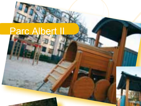
Parc Albert II