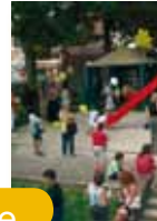
Plaine Petite Suisse