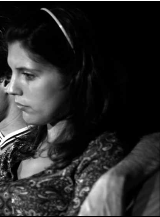
Des hirondelles comme une feuille morte

sa nouvelle amie. Tom suivra-t-il son cœur et des sentiments qu'il n'a jamais ressentis auparavant, ou succombera-t-il à sa faiblesse? L'amour a-t-il besoin de l'approbation de la société pour être entier?