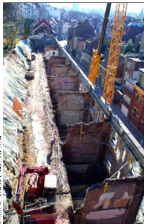
© Service de l'Architecture - Dienst Architectuur

La logique verticale initiale (une entrée par maison individuelle) a été remplacée par une logique horizontale, par plateaux traversant les maisons en largeur. Sur les dix cages d'escaliers, trois ont été conservées, reliées à trois entrées extérieures. Les emplacements des portes resteront cependant visibles pour conserver l'harmonie actuelle. L'ajout d'un étage en toiture au trois niveaux existants confère à l'ensemble un gabarit plus proche du pont et des immeubles voisins.