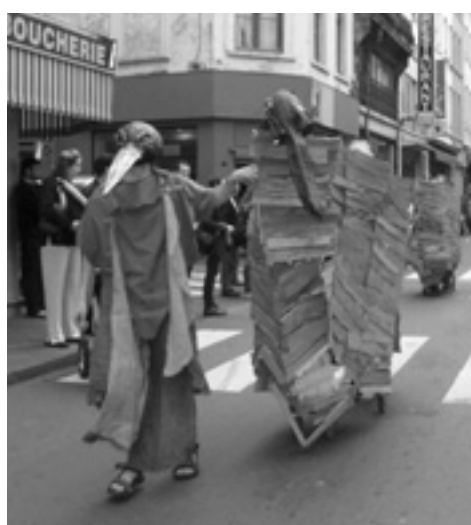
De "Coucou Puissant" heeft het (heerlijke) Bier van de Grote Gevoelens voorgesteld