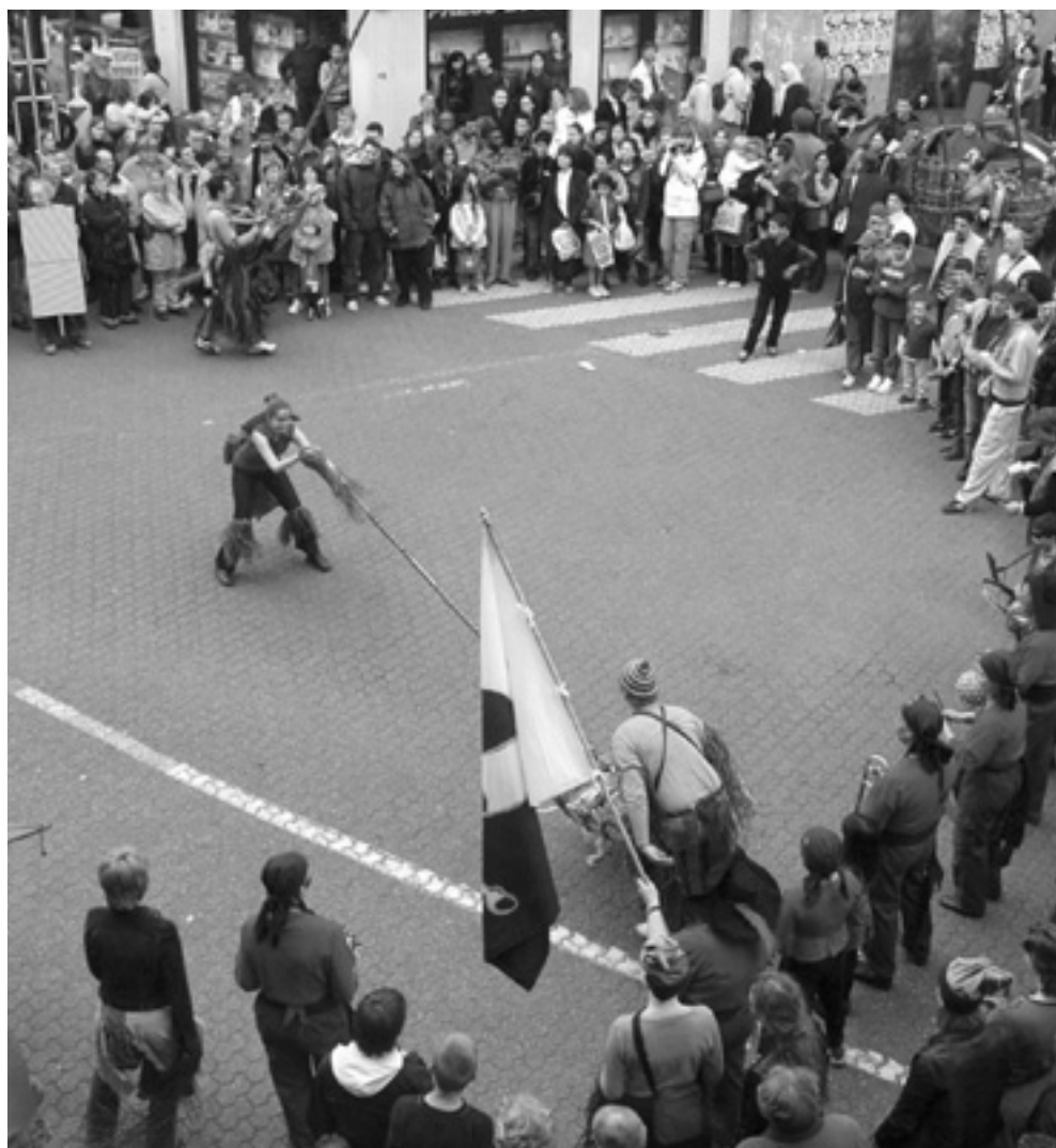
A la Porte de Namur, la Danse de la Crevette sur les rythmes endiablés de la Nouvelle Flibuste

Avant la Zinneke Parade du 25 mai, les Zinnekes d'Ixelles envahissent les rues de leur quartier. Voor de Zinneke Parade van 25 mei overspoelen de Zinnekes van Elsene de straten van hun wijk. Avec/met GC Elzenhof, la Nouvelle Flibuste, la Commune d'Ixelles/Gemeente Elsene, le Musée de Enfants, l'Ecole Sans-Souci, Dynamo asbl, la Chorale FEDA, le Coucou Puissant asbl, CEC ULB, La Cambre (2 e année scéno), Passeurs de Rêves, la Maison de la Jeunesse et/en l'Espace Bien-être