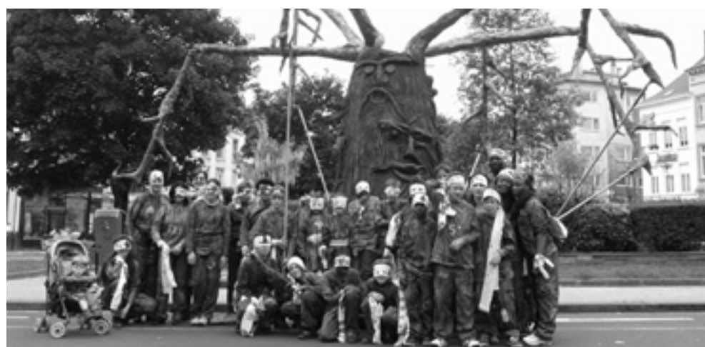
La pièce-maîtresse du Cortège: l'Arbre à Sentiments et ses constructeurs de tous âges