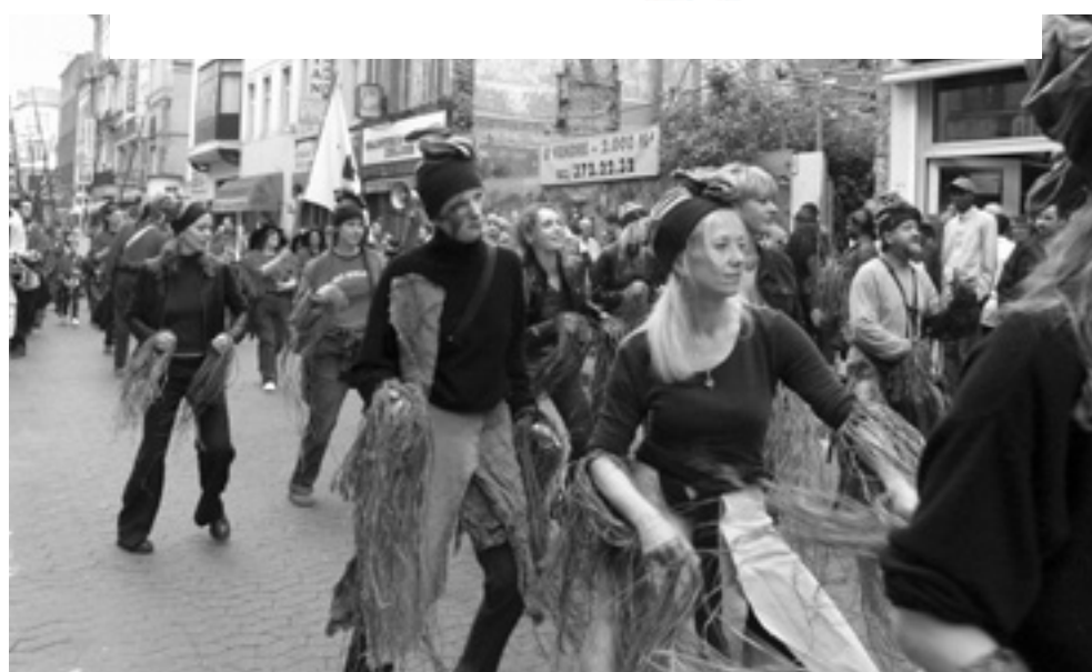
Place Fernand Cocq, rue de la Paix, Matongé, Porte de Namur, chaussée d'Ixelles et retour: deux heures d'intense convivialité!