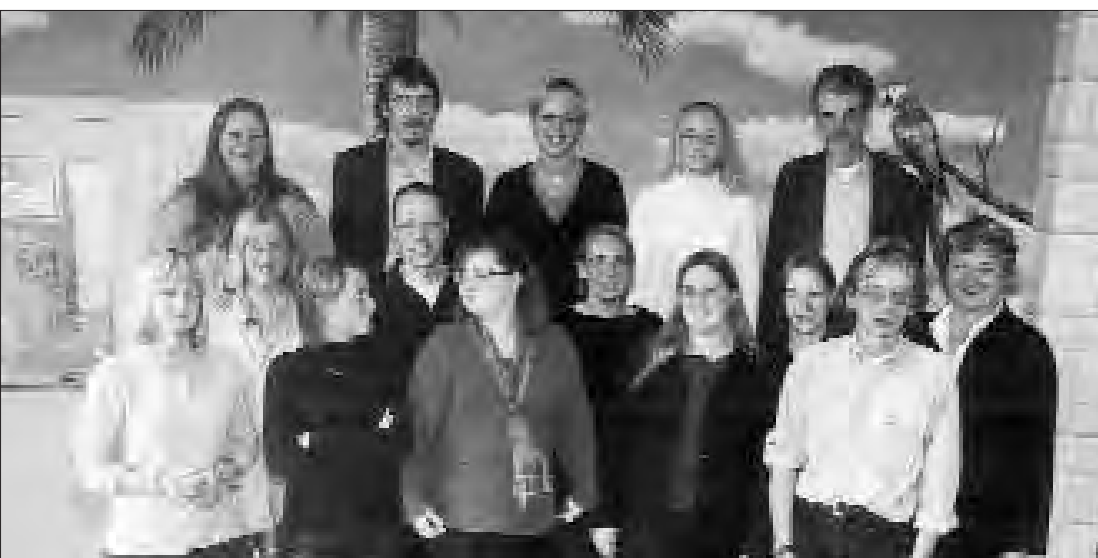
QUELQUES-UNS DES ASSISTANTS SOCIAUX DU CPAS.

Toute personne a droit à l'aide sociale et sous certaines conditions de nationalité, de résidence et de ressources, le droit à un minimum de moyens d'existence (minimex). Le Centre public d'Aide sociale - CPAS, pivot de l'aide sociale délivrée au niveau communal, a pour mission de mettre en œuvre ces droits en assurant aux personnes et aux familles en difficulté, voire en détresse sociale, l'aide due par la collectivité.