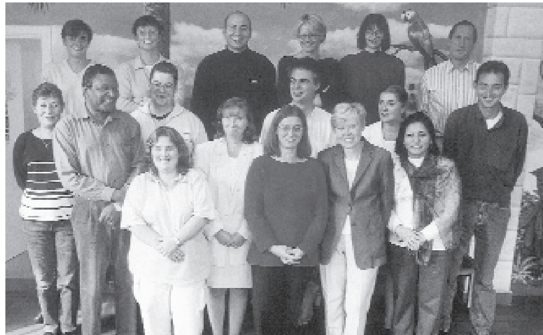
DE ADMINISTRatieve PLOEG VAN DE SOCIALE DIENST

Maar de financiële hulp is maar één aspect van de actie van het O.C.M.W.: men kan ze niet tot de uitkering van een "cheque" beperken. Het doel is een ware steun te bieden aan de personen die vaak zeer eenzaam voor hun moeilijkheden staan en waaronder velen bittere ervaringen in hun leven hebben gekend, bij andere sociale diensten of besturen. Ontvangen, luisteren, inlichten, aanraden, oriënteren, een psychosociale begeleiding bezorgen, dit zijn de voornaamste taken van de maatschappij-